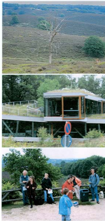
So mei 2007 Etenwijk naar Het Kleeflied.